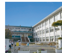
富水小学校 泉中学校