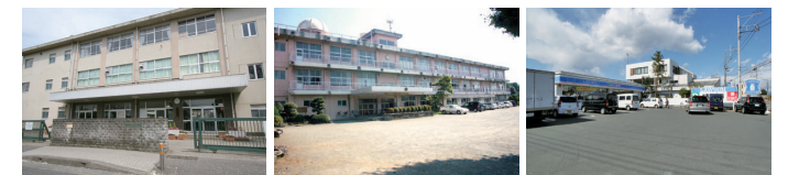
足柄小学校 白山中学校 ローソン